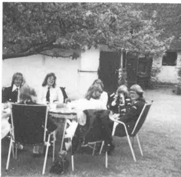
Mellom slagene. Fra Danmarksturen 1975.

- andre spilleoppdrag for lag og foreninger, spesielle konserter i andres eller egen regi