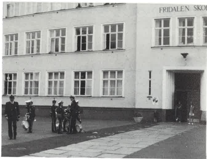
Slagverksgruppen gjør seg klar. Fra Bergensturen 1978.

1971 Tur Kristiansund 1972 Tur Roskilde, Danmark 1974 Landsdelsstevne, Skien 1975 Tur Danmark 1978 Landsdelsstevne, Bergen 1979 Tur York, England I jubileumsåret vil turen gå til Finland