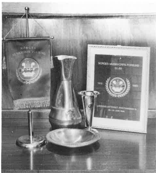
Noen utmerkelser fra de senere år.