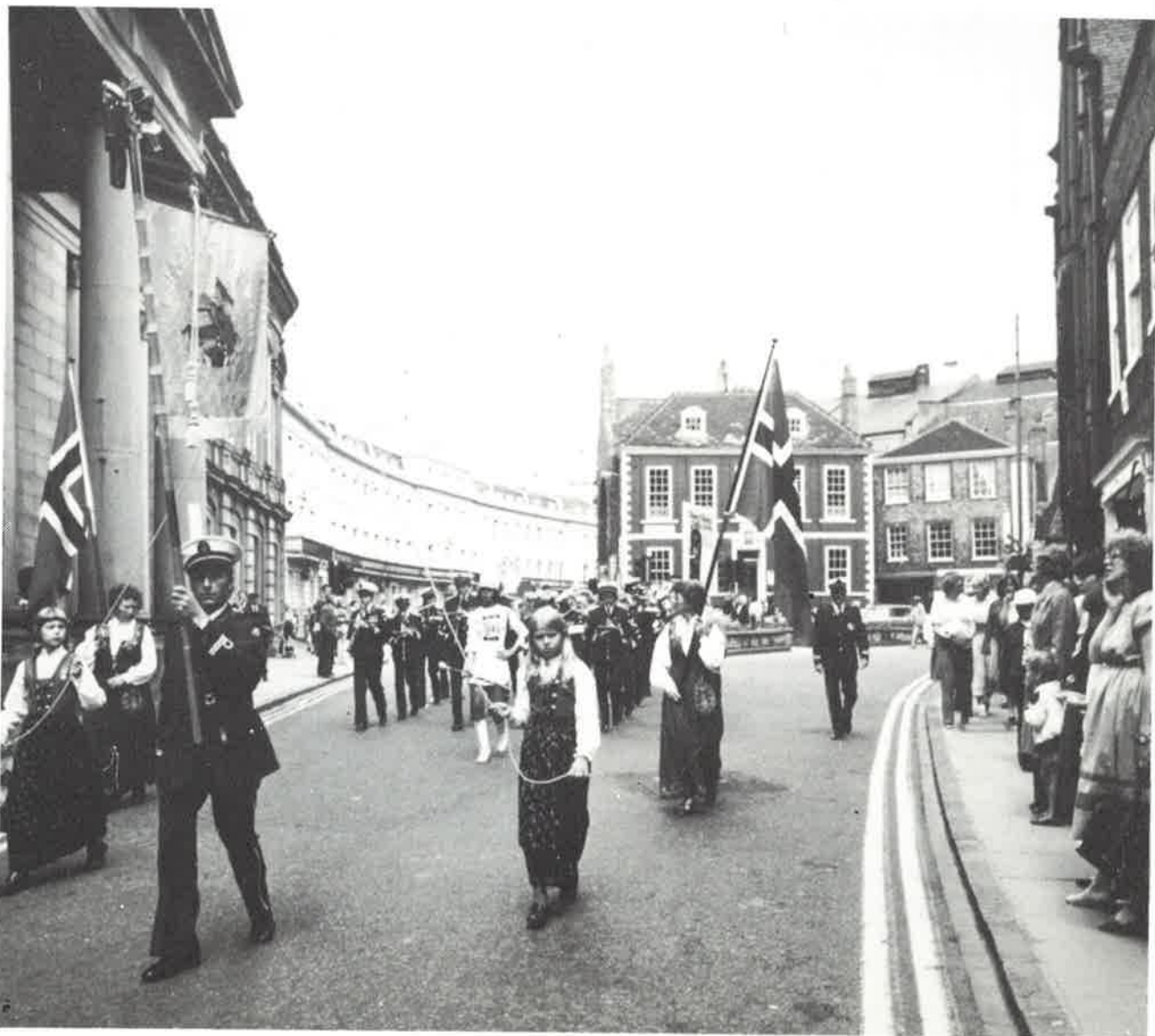
På marsj gjennom York. Fra Englandsturen 1979.